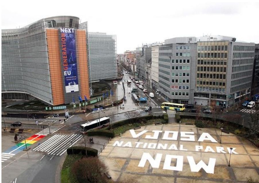
EU-Kommission in Brüssel/Belgien