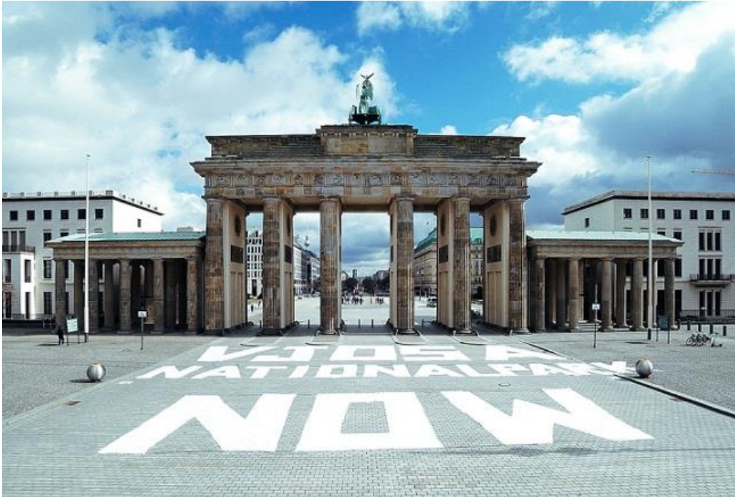
Brandenburger Tor in Berlin/Deutschland

In ganz Europa gehen Süßwasserlebensräume schneller verloren als jeder andere Lebensraumtyp. Weltweit gehören sie zu den gefährdetsten Ökosystemen. In Europa gibt es einen durchschnittlichen Rückgang von 93 Prozent bei wandernden Süßwasserfischen. Lebensraumzerstörung ist einer der Gründe dafür. Wir dürfen die einmalige Chance nicht versäumen, dem großen Wert dieses Hotspots der Biodiversität gerecht zu werden und diesen intakten Fluss zum Wohle von Mensch und Planet zu bewahren.