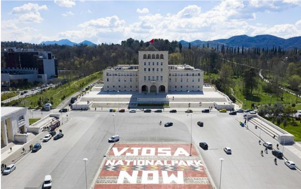
Universität Tirana /Albanien